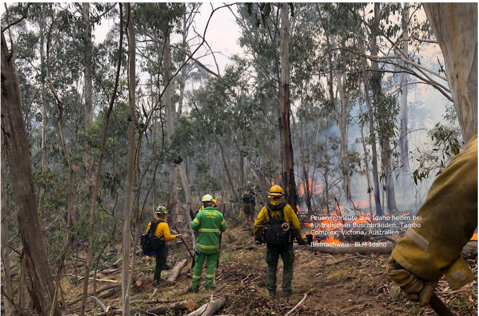
Feuerwehriente aus Idaho helfen bei australischen Buschbränden, Tambo Complex, Victoria, Australien