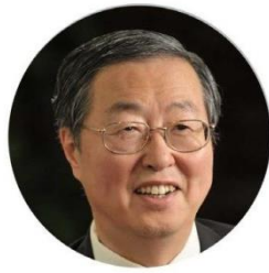
Zhou Xiaochuan China