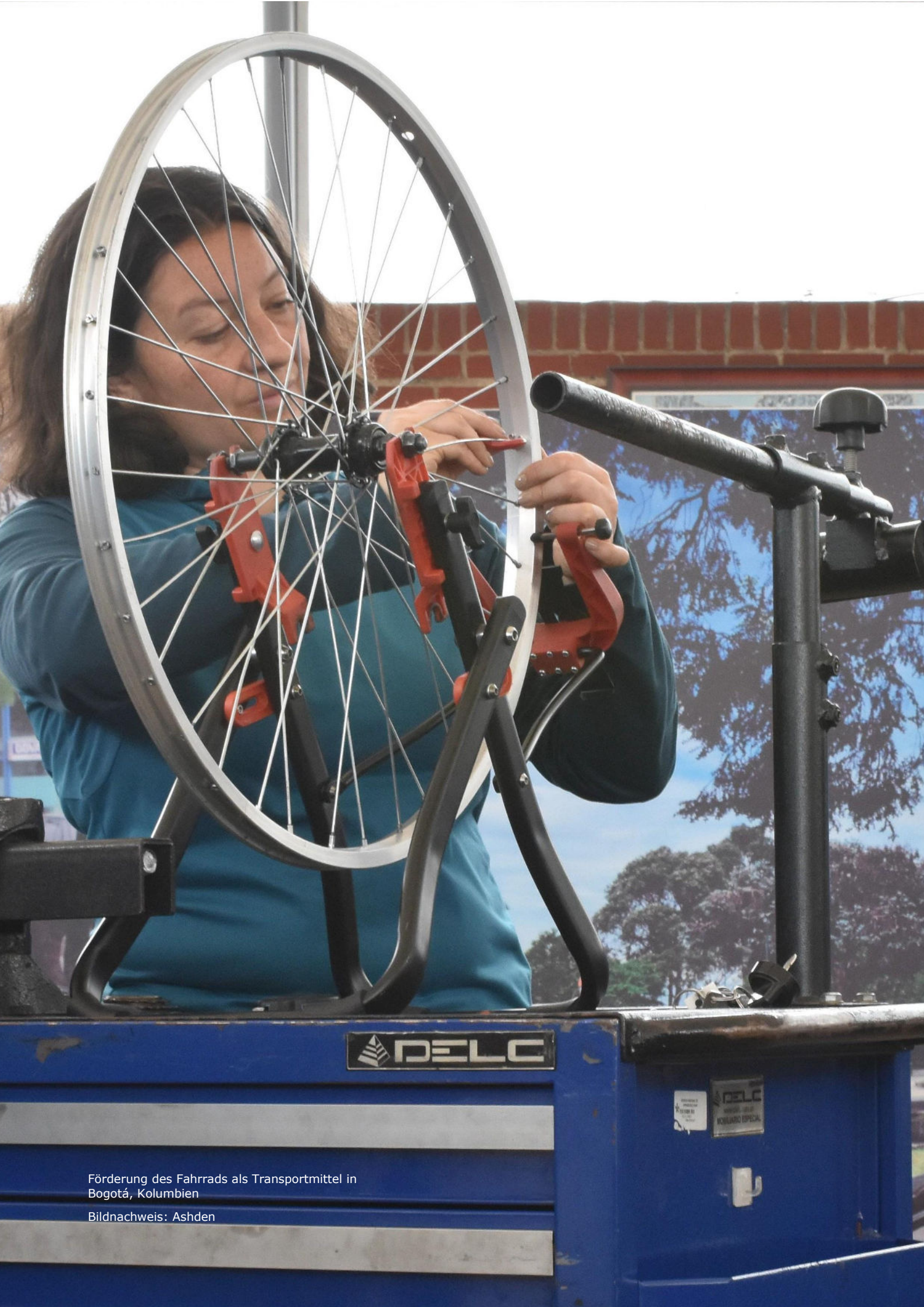
Förderung des Fahrrads als Transportmittel in Bogotá, Kolumbien