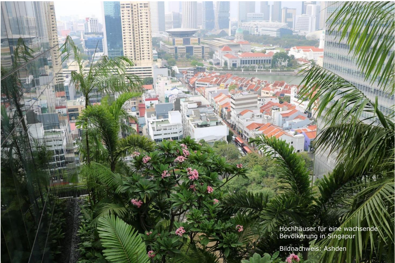
Hochhäuser für eine wachsende Bevölkerung in Singapur