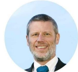
Rod Carr Neuseeland

Oumar Tatam Ly ist ehemaliger Premierminister von Mali (2013-2014). Zuvor war er Sonderberater des Direktors der Westafrikanischen Zentralbank und Vorsitzender des Verwaltungsrats des Pensionsfonds der Westafrikanischen Währungsunion (CRRAE-UMOA).